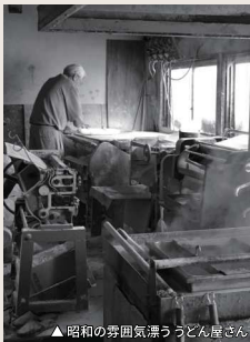
▲昭和の勢田風流うどん屋さん